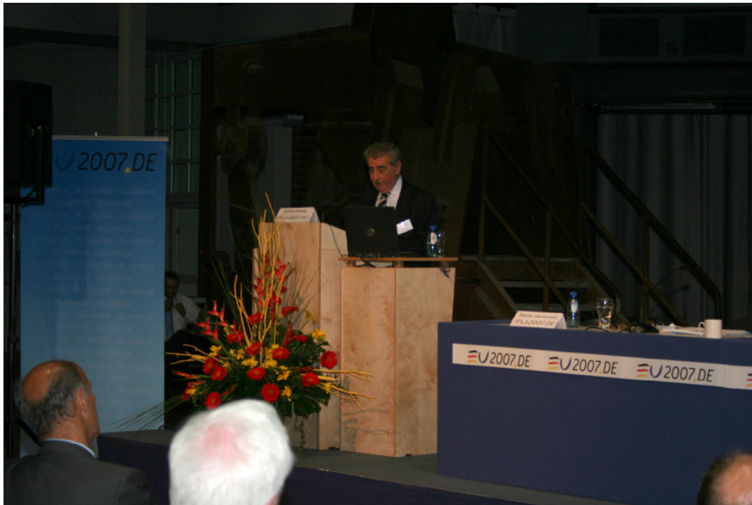
Vito Foá, chairman of the European Scientific Committee on Occupational Exposure Limits (SCOEL), Milano, Italy